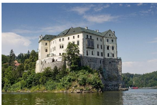
Přemysl Otakar II.