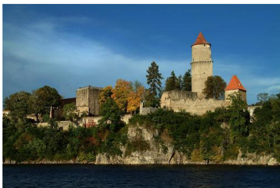
Přemysl Otakar I.

Nápovědou ti je jméno krále, který se pojí s historií hradu.