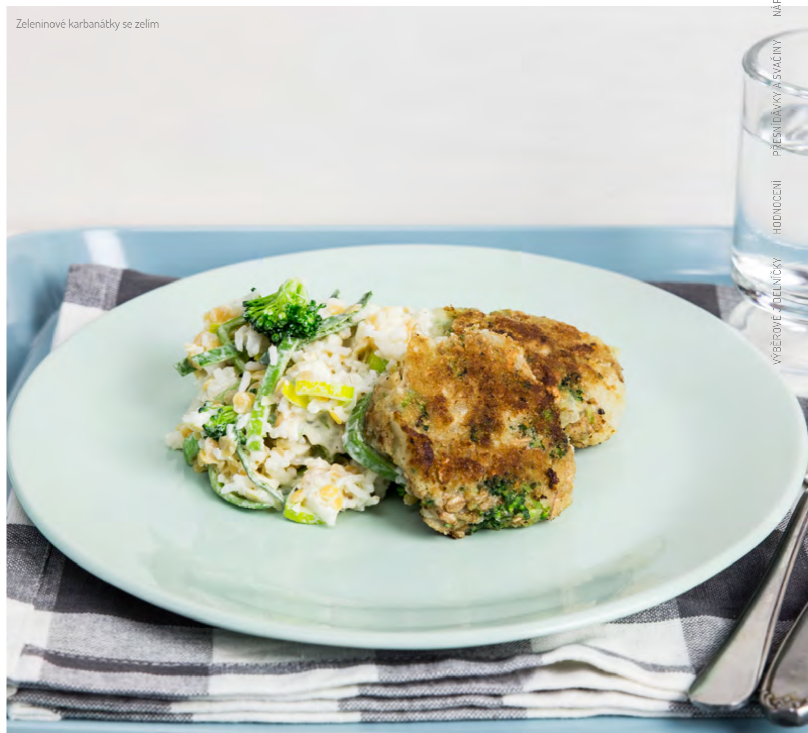
Zeleninové karbanátky se zelím