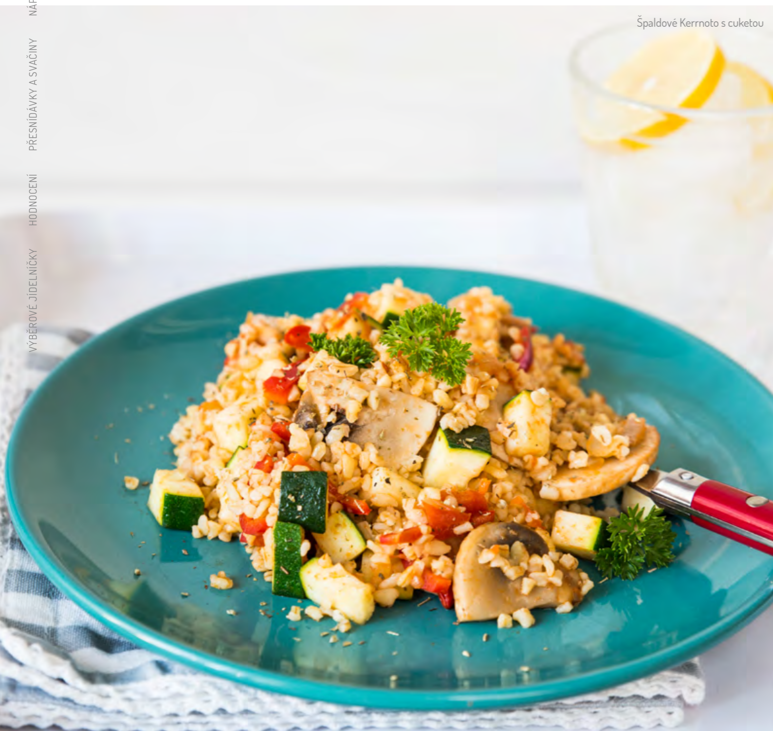
Špaldové Kernoto s cuketou

S ohledem na stále nedostatečnou konzumaci zeleniny dětskou populací, což dokladují i výsledky úkolu vyhlášeného hlavním hygienikem ČR v roce 2011 a 2014 „Monitoring nabídky potravin školním a doplňkovým stravováním pro žáky základních škol“, je nutné této kategorii potravin při sestavování jídelníčků věnovat přednostní pozornost.