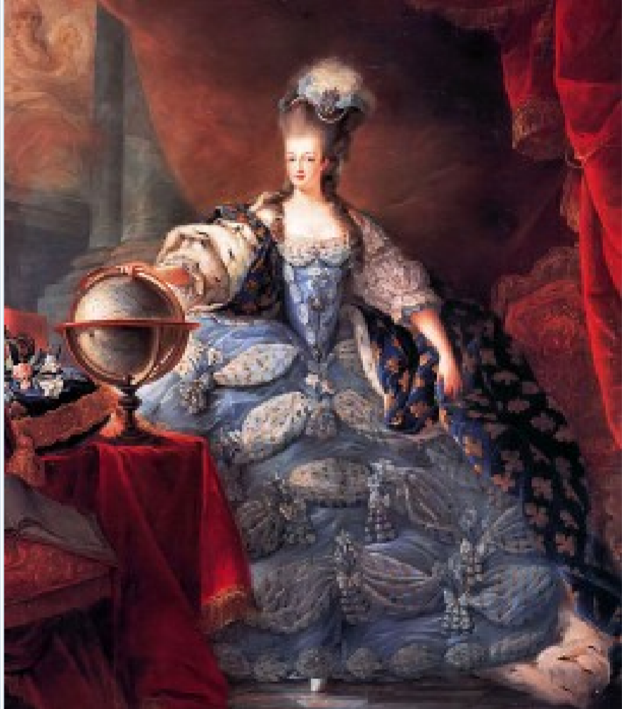
Marie Antonie „Antoinetta“ Josefa Johana Habsbursko-Lotrinská (1755 – 1793) byla nechvalně známá svou oblibou drahých látek a šperků