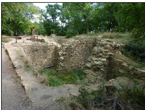
Dnešní podoba Hrádku

Více info na https://www.praha-kunratic.cz/historie-soucasnost/1463-novy-hrad