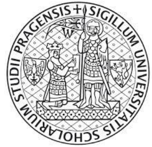
Pečeť Karlovy univerzity

Karel byl na svou dobu velice vzdělaným panovníkem. Uměl číst a psát a ovládal pět jazyků. Sepsal svůj vlastní životopis – VITA CAROLI („Život Karlův“), ve kterém mimo jiné zaznamenal pro své následníky panovnické zkušenosti. V roce 1348 nechal v Praze založit první univerzitu ve střední Evropě a z Prahy tak učinil centrum vzdělanosti.