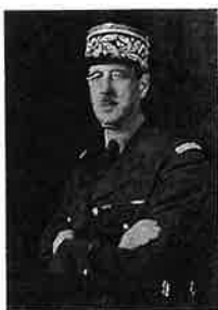
Charles de Gaulle [gól]

Jakou roli sehrál Ch. de Gaulle za 2. světové války?