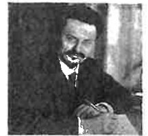
Lev Davidovič Trockij

1 Oprav následující text tak, aby odpovídal pravdě: Občanskou válku v Rusku vyhráli menševici. V roce 1922 se Rusko přejmenovalo na Ruskou federaci. Po smrti Mikuláše II. se stal sovětským vůdcem J. V. Stalin. Zemědělská půda byla pokojnou cestou kolektivizována.