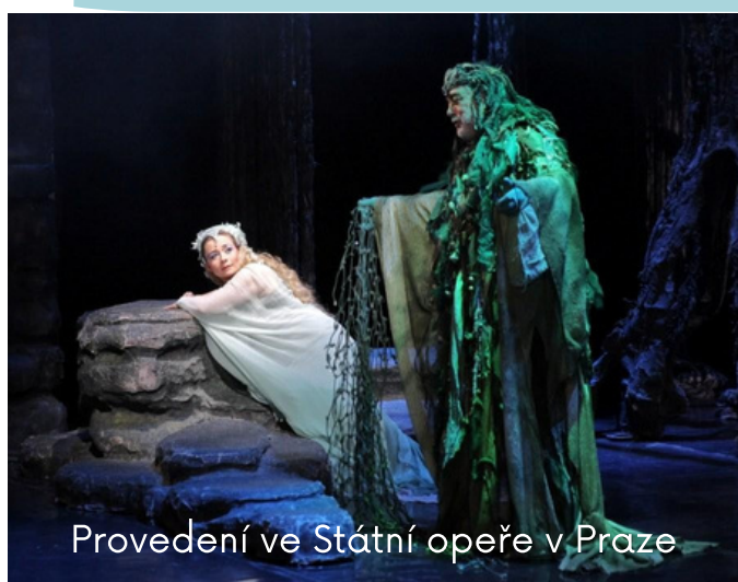
Provedení ve Státní opeře v Praze

Lesní víla ..... [tajenka] se zamilovala do krásného prince. Jejich lásce však nebylo přáno. I její tatíček vodník ji odrazuje od této marné lásky. Ona však uzavře smlouvu s čarodějnící, která tajemným kouzlem a lektvarem s dračí krví, žlučí a tlukoucím srdcem ji promění v člověka, ale sebere jí hlas. Princ ji najde samotnou v lese, a odnese ji na zámek. Na zámku probíhá ples, na kterém si princovu pozornost získává cizí kněžna. Princ jejímu svodu podlehne a nešťastná ..... [tajenka] uteče ze zámku zpět do lesa. Za tuto zradu Vodník prince prokleje. Princ si uvědomí svou chybu, běží za ní a vyzná jí svou lásku, avšak pozdě. V tajemném lese na palouku v láskyplném objetí princ omámen umírá v jejím objetí.