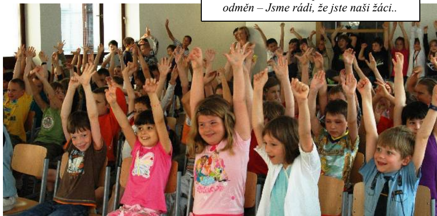
26. června 2008 – z předávání knižních odměn – Jsme rádi, že jste naši žáci..

Jsmo si vědomi, že efektivní vyučování dělá kvalitní učitel. Proto i pro příští rok plánujeme systematické vzdělávání celého pedagogického sboru. Snažíme se umožnit učitelům jejich odborný růst nejen při společných seminářích, ale i podle vlastní volby. I z důvodu dalšího vzdělávání učitelů, ale například z důvodu realizace preventivních programů a environmentální výchovy jsme v tomto roce podali několik projektů. Některé z nich byly přijaty a finančně podpořeny, na přijetí jiných doposud čekáme.