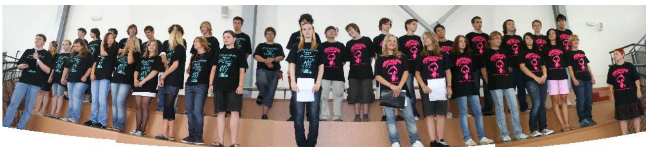
26. června 2008 – deváťáci se loučí – POSLEDNÍ ZVONĚNÍ.

Přeji všem slunečné prázdniny, děkuji Vám za Vaši podporu Základní školy Kunratice a těším se na spolupráci s Vámi v novém školním roce 2008/2009. Vít Beran, ředitel školy /červen 2008/