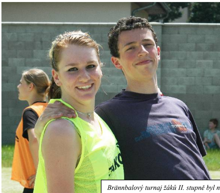
Brännbalový turnaj žáků II. stupně byl na Den dětí v nohodově atmosféře.

Je Základní škola Kunratice dobrou školou? Věříme, že jsme vyšli správnou cestou. Podle čeho jsme to poznali? Je několik ukazatelů. Naše škola se dostala do pozornosti asistentů vysokých škol, které připravují studenty na povolání učitel. V tomto školním roce nás navštívilo několik skupin studentů v rámci studia pedagogiky. Svě dlouhodobé praxe zde absolvovali studenti z katedry primární pedagogiky, budoucí učitelé zeměpisu, přírodopisu, českého jazyka, občanské a výtvarné výchovy. Užší spolupráci jsme navázali i s katedrou výchovné dramatiky DAMU. Čím to je, že si vysokoškolští učitelé vybírají pro své studenty naši školu? Jsem přesvědčen, že máme mnoho vynikajících učitelů, ale současně musím konstatovat, že procházíme v některých předmětech jejich obměnou. Ve škole přibývá dětí i tříd, z patnácti kmenových tříd jich od září bude sedmáct. Poprvé se v Kunraticích otevírají tři první třídy v jednom ročníku. Současná čtvrtá třída bude mít v příštím školním roce více jak 35 žáků,