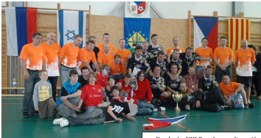
Fandové z VIII.B podporovali v naší sportovní hale české barvy na ME v sálovém fotbale veteránů.

Potřebujeme nutně doplnit fond učebnic a vybavit školu pomůckami. V minulosti toto bylo dost zanedbáno. Proto jsme se rozhodli navázat užší spolupráci s nakladatelstvím Fraus /www.fraus.cz/ a stali jsme se jejich partnerskou školou. Toto nakladatelství nabízí jedny z nejmodernějších a nejefektivněji uspořádaných učebnic doplněných o pracovní sešity, manuály pro učitele, slovníky, atlasy a interaktivní prezentační a vyučovací systémy. Nakladatelství Fraus jako jedno z mála používá při výrobě učebnic technologii, kdy učebnice jsou v hřbetech současně šité a lepené, proto si myslíme, že nám takového knihy dlouho vydrží. Rádi bychom v příštím roce pořídili komplet učebnic pro první třídy a současně kompletně vyměnili učebnice druhého stupně základní školy. Tato proměna bude spojena i s dovybavením školy některými učebními pomůckami a interaktivními tabulemi. Zrealizování