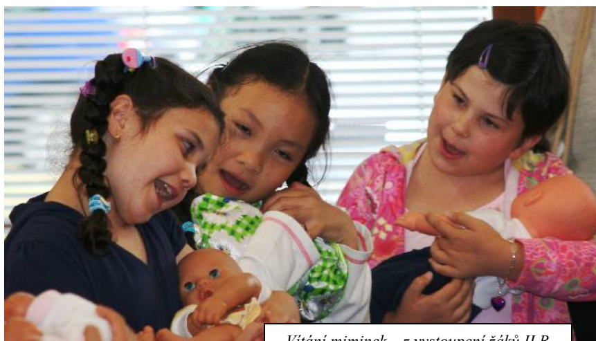
Vítání miminek – z vystoupení žáků II.B na kunratické radnici.

Končí školní rok, který byl pro nové vedení školy prvním celým školním rokem. Závěr minulého a první čtvrtletí tohoto školního roku byly ještě poznamenány rekonstrukcí a dostavbou,