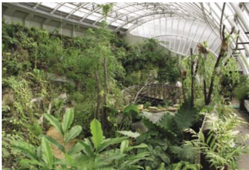
Skleník Fata Morgana otevřený v r. 2004 v Botanické zahradě hl.m. Prahy umožňuje návštěvníkům seznámit se s rostlinstvem tropického a subtropického klimatického pásma díky členění do tří samostatných částí s rozdílnou teplotou a vlhkostí vzduchu.