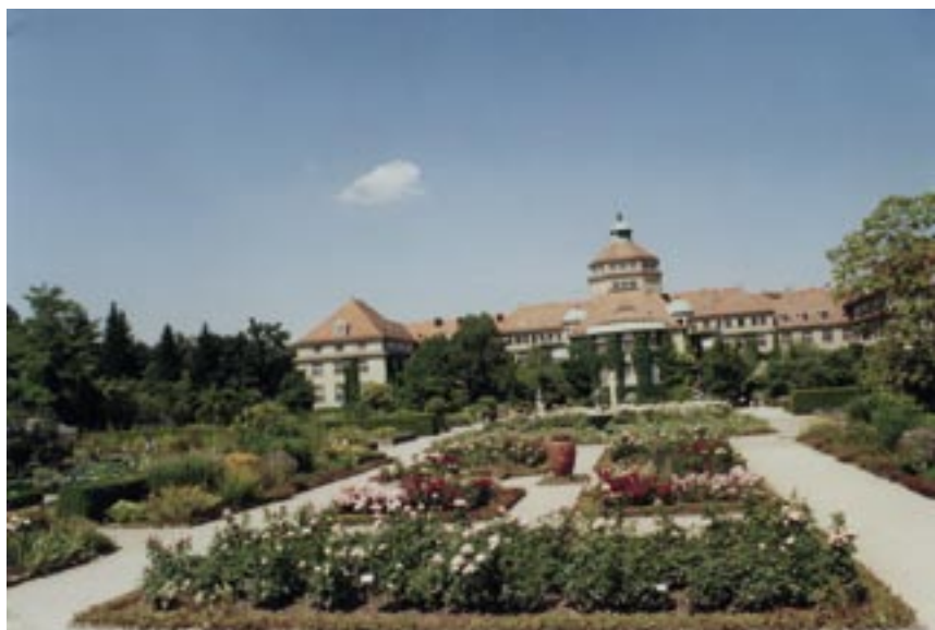
System rostlin propojený s esteticky působivým uspořádáním centrální části Botanické zahrady Mnichov.