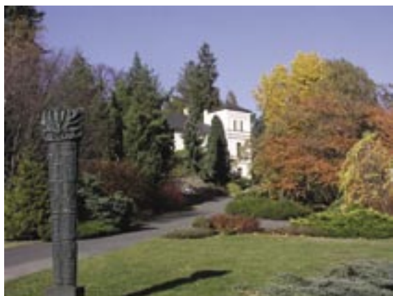
Arboretum Nový Dvůr – významná sbírka domácích a cizokrajných dřevin doplněná skleníkovými expozicemi subtropických a tropických rostlin ze všech kontinentů.