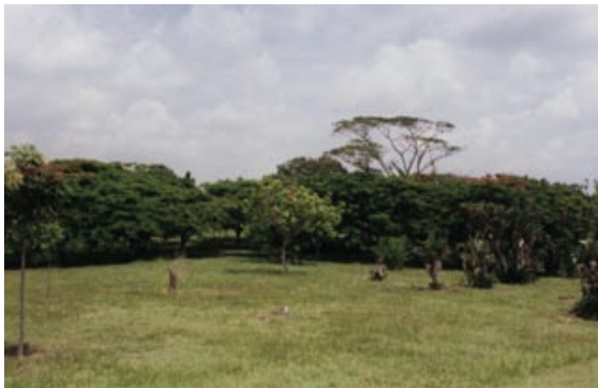
Moderní botanické zahrady s dostatkem prostoru umožňují uspořádání dle rostlinných formací (Botanická zahrada Havana).