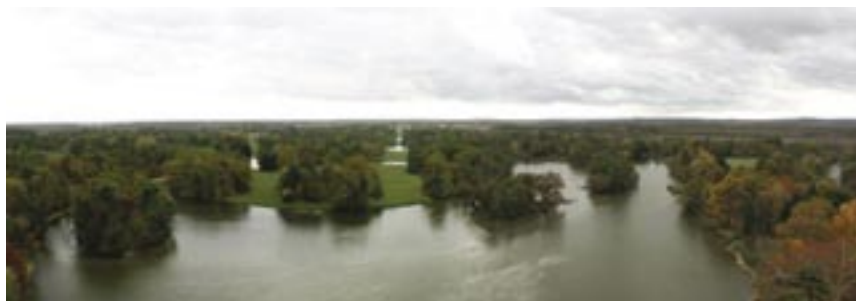
Vhodné zasazení do krajiny s využitím prostoru – park Lednice na Moravě (Lednicko-Valtický areál byl zařazen do Seznamu kulturního a přírodního dědictví UNESCO).

Publikace byla vypracována v rámci Projektu UNEP/GEF Přístup ke genetickým zdrojům a rozdělování přínosů z nich, ochrana a udržitelné využívání biodiversity důležité pro zemědělství, lesnictví a výzkum – Česká republika (odhad potřebných kapacit) Assessment of Capacity-building Needs: Access to Genetic Resources and Benefit-sharing, Conservation and Sustainable Use of Biodiversity Important for Agriculture, Forestry and Research – Czech Republic