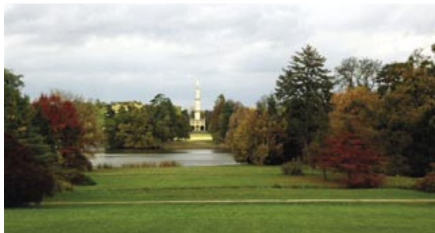
Partie domácích i introdukovaných dřevin v rozlohou druhém největším krajinářském parku České republiky v Lednici na Moravě jsou doplněny romantickými stavbami (minaret z období 1797-1802;).