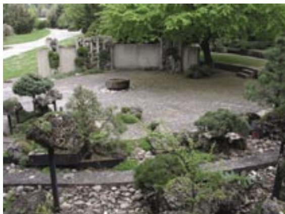
Botanická zahrada a arboretum Mendelovy zemědělské a lesnické univerzity v Brně představuje též části s netradičním architektonickým řešením.