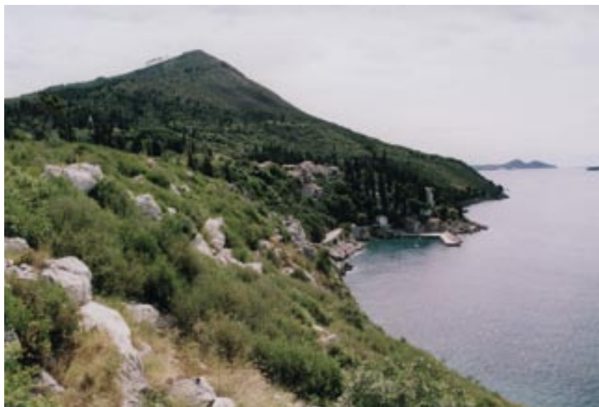
Arboretum Trsteno, Chorvatsko – sbírka středomořských a introdukovaných subtropických rostlin v kombinaci se zbytky antické kultury (foto M. Roudná).