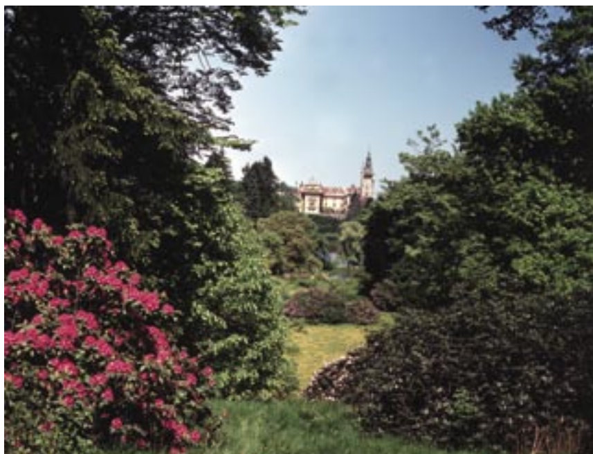
Průhonický park představuje krajinářsky ztvárněnou cennou sbírku dřevin na největší rozloze v České republice.