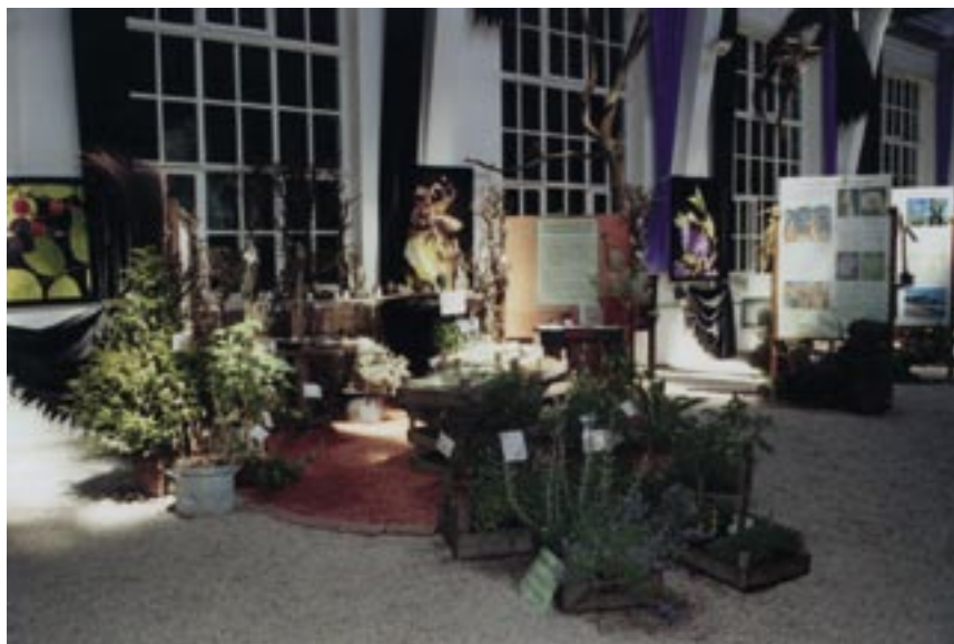
Tématické výstavy jsou vhodnou formou šíření znalostí o rostlinách mezi širší veřejností (Botanická zahrada Mnichov).