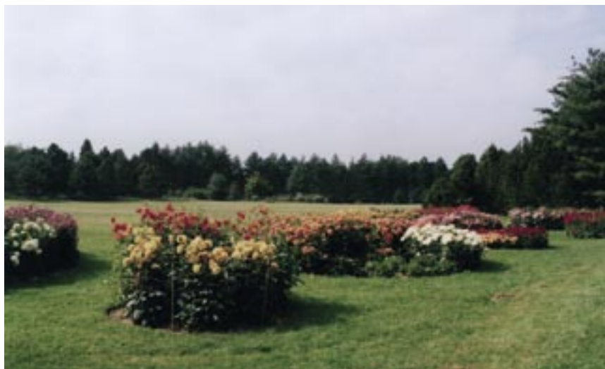
Uspořádání sbírek v Dendrologické zahradě Výzkumného ústavu Silva Taroucy pro krajinu a okrasné zahradnictví v Průhonících s využitím některých částí původních výsadeb Dendrologické společnosti.