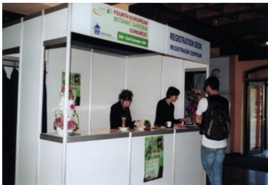
Čtvrtý evropský kongres botanických zahrad se konal v září 2006 v Průhoncích.