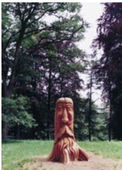
Arboretum Hrubá Skála – socha „Duch arboreta“ (I. Šmíd) vytesaná z torsa nejstarší douglasky (foto M. Roudná).