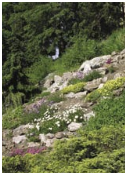
Alpínium v Botanické zahradě Univerzity Karlovy v Praze.