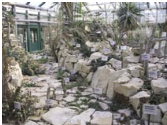
Bohaté skleníkové expozice v Botanické zahradě Liberec.