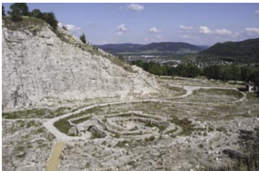
Botanická zahrada ve Štramberku založená v prostoru bývalého vápencového lomu plní důležitou úlohu v ochraně lokální flóry.