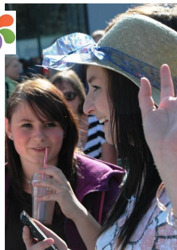
Zahradní slavnost 2010