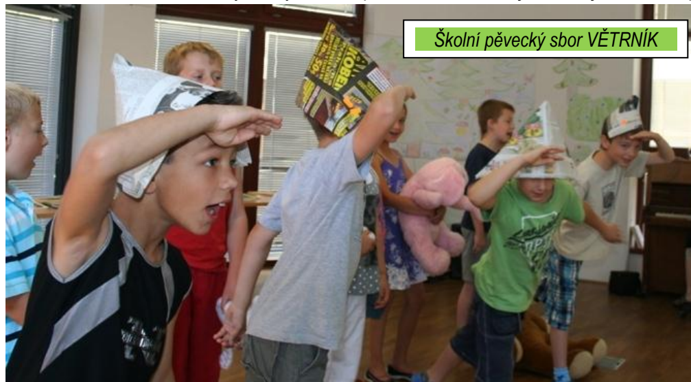
Školní pěvecký sbor VĚTRNÍK

Za prvé naše škola vstoupila do projektu „Pomáháme školám k úspěchu“ , který je pro všechny naše kolegy velkou výzvou a měl by se stát výzvou i pro všechny žáky a jejich rodiče. Projekt nám umožnil zaměřit se na pedagogický rozvoj školy, zvýšit efektivitu učení a podpořit osobní rozvoj každého žáka. Podpora, kterou jsme díky projektu získali, nám umožnila začít využívat asistentky pedagoga a také služby projektové konzultantky. To vše se odráží na práci pedagogů a je znatelná na výstupech žáků, např. v šetření Kalibro jsme se u řady tříd dostali do skupiny škol hodnocených v první desetině až třetím decilu zúčastněných škol. Excelentní výsledky dosáhli žáci 3. B v testech Kalibro a v testech Scio 6. B. S očekáváním se těšíme na výsledky šetření průzkumu Škola a já, které je finančně podpořeno, zřizovatelem městské části